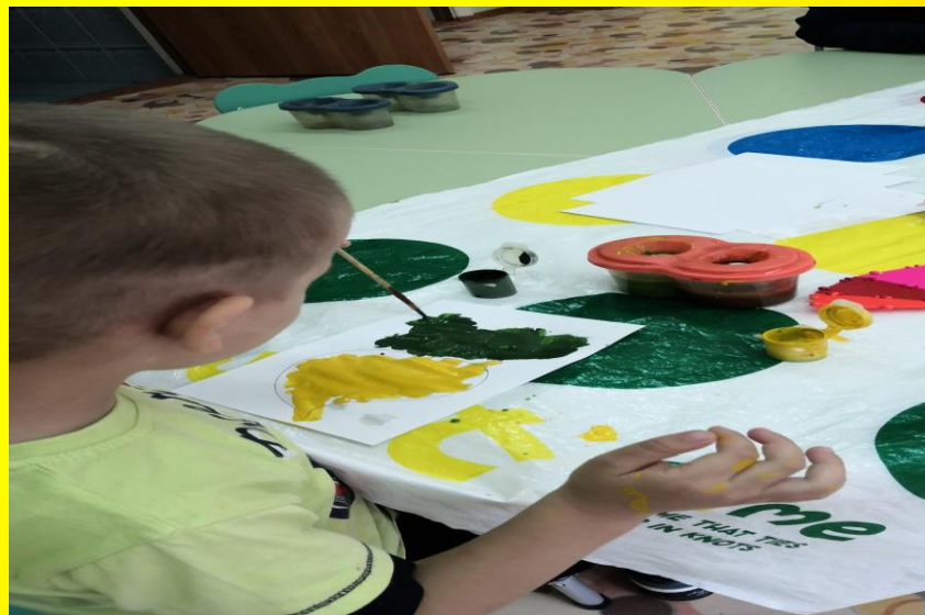
Рисование: «Овощи», «Фрукты»